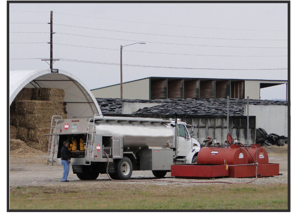
Maneje y estacione en las áreas designadas. Siga todas las señales indicadas.