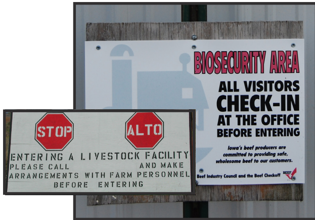
Asegúrese de estar autorizado para ingresar a esta granja.