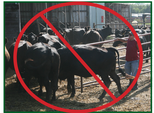
Evite contacto directo con ganado bovino, alimento, estiércol y otras excreciones. Si el contacto con el ganado bovino es necesario, siga los protocolos de bioseguridad obligatorios para evitar la introducción o propagación de una enfermedad.