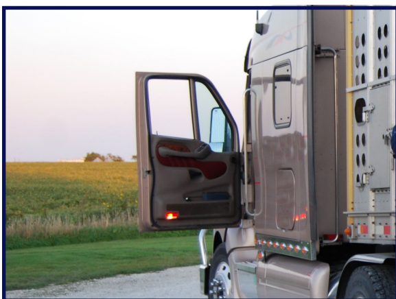
Asegúrese que su equipo, vestimenta y calzado no estén sucios antes de ingresar a su vehículo para evitar contaminación cruzada entre granjas.