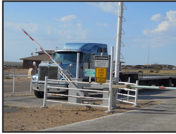
Respete la Línea de Separación (LOS) entre el tráfico dentro y fuera de la granja. Siga los protocolos de bioseguridad obligatorios cuando cruza la LOS.