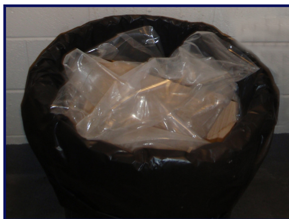
Deje atrás cualquier tipo de residuo generado en la granja.