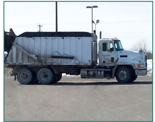
Un camión utilizado para transportar animales muertos