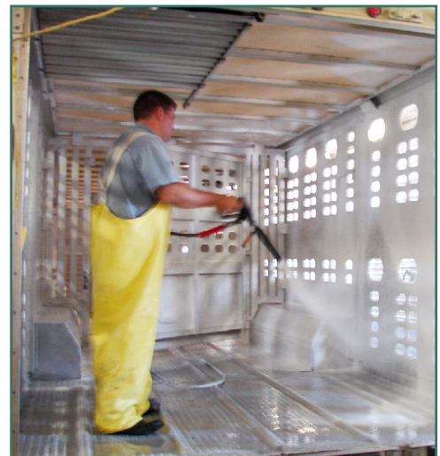
El lavado de remolque.