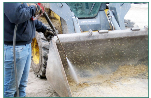
La limpieza y desinfección de maquinaria pesada.